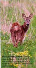
NESTE GENERASJON: Et duktig rådyrbarn i naturen. Fredelig råknutningen, kun oppført av å skaffe lokelse og til seer seg, og i så måte jammens funn snart skal føre...