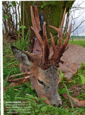
MONSTERBUKK: Denne her! Spasjerte bukker har ni bukker og ble etter jakt og skåner målt i en god grill-meditasjon etter CIC-metoden.

Men klok av skade kjenner jeg utmerket godt mine egne begrensninger og vesper en omgående bevegelse med venstrearmen. Guiden er tydelig berømt, området er litt vel åpent, men noen frodlige skogsbolmer bør gjøre det mulig å komme betydelig nærmere.