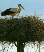
ARTIG FUGL: Fremdeles er størrelsen vanlig syn i Polen, et morsomt og kjert innslag på landsbygda.

Rimelig spent etter tre-fire hunderte meter polsk dikkvandrings, stes i et stille øyeblikk opp, tar jeg endelig sjansen. Kraver meg i land til fastere fotfeste, og der går jammens dyrene og beiter rett fram meg. Det som imidlertid er litt bekymringsfullt er avstanden, garantert gode to hundre meter er allri til absolutt i overkant av å vise føler meg komfortabel med. I alle fall på frihånd og med et rifle som er skutt inn hjemme i Norge med byldeemper, men som ikke er tillatt å brenge i Polen.