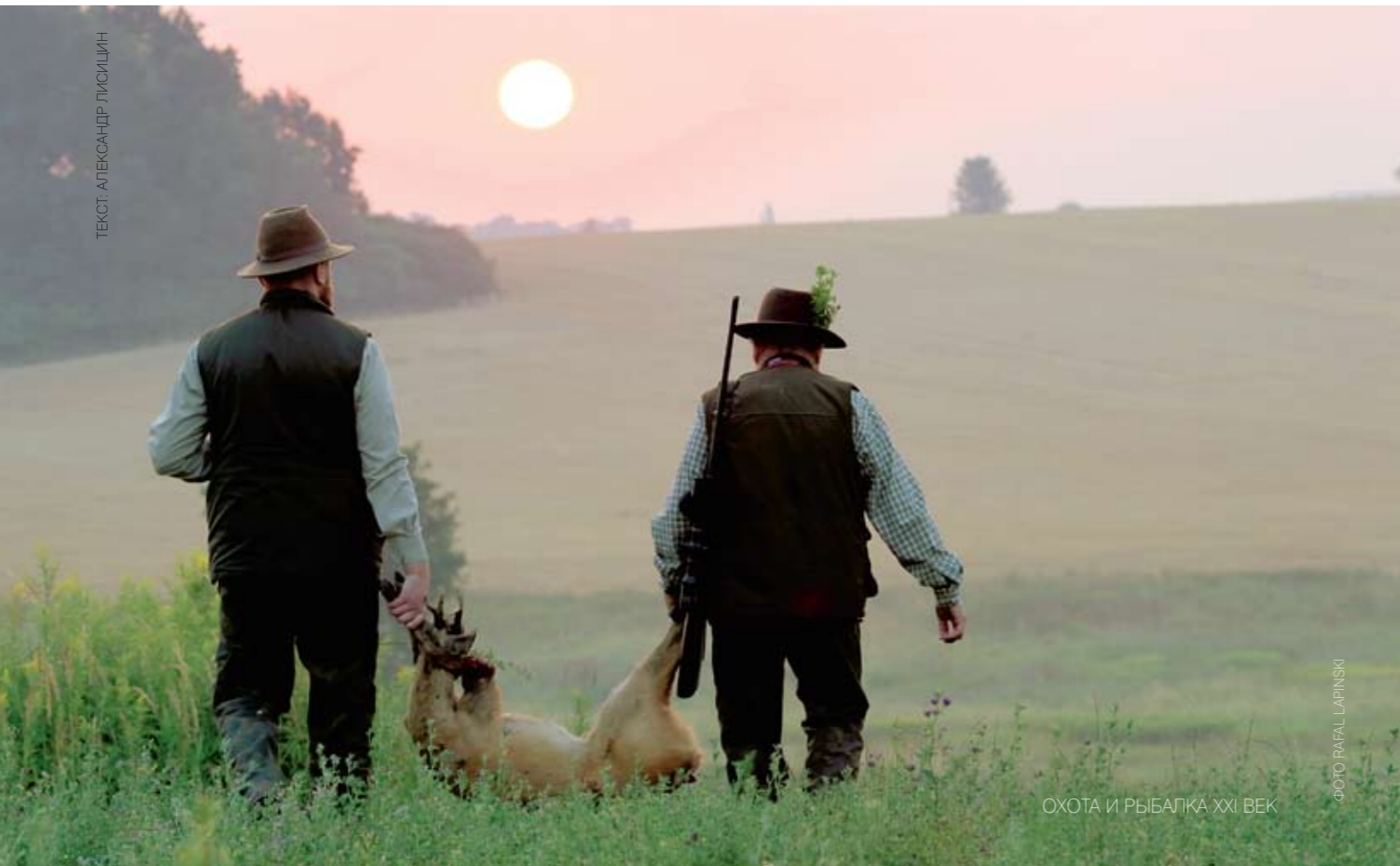
ОХОТА И РЫБАЛКА XXI ВЕК

Раннее утро. Охота закончилась. Пора домой.